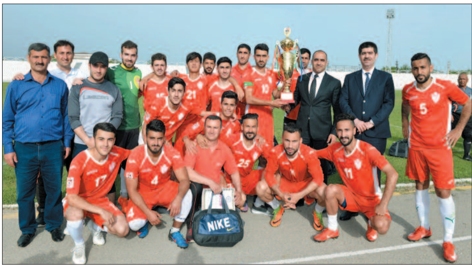
Naxçıvan Muxtar Respublikası Gənclər və İdman Nazirliyi ilə Futbol Federasiyasının birgə təşkil etdiyi ümummilli lider Heydər Əliyevin anadan olmasının 95-ci ildönümünə həsr edilmiş futbol üzrə "Heydər Əliyev kuboku" uğrunda muxtar respublika turnirinin yekun vuruşu.

Naxçıvan Muxtar Respublika Stadionunda keçirilən final qarşılaşmasında "Araz-Naxçıvan" və Naxçıvan Dövlət Universitetinin komandaları üz-üzə gəliblər.